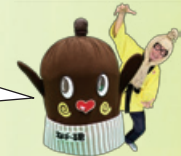
ねば～る君と納豆お兄さん