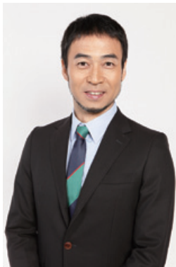
お笑い芸人 ペナルティ ワッキーさん

1994年2月ヒデとペナルティを結成。4月銀座7丁目劇場のオーディションに合格しデビュー。筋肉芸人としても知られ、「お笑い界一」と称されたこともあるほどの身体能力の持ち主。2020年4月中咽頭がんが発覚し、2か月の入院と10か月の休養に入った。がん発覚から10キロ弱も体重を落とす程の過酷な闘病生活を経て、2021年2月に仕事復帰。現在は自身のyoutubeチャンネル「ペナルティちゃんねる」で活躍中。相手との再会どっきりでは感動を呼び話題となった。